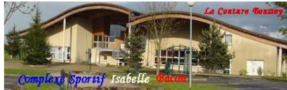
Association Loi 1901 n° w273000369